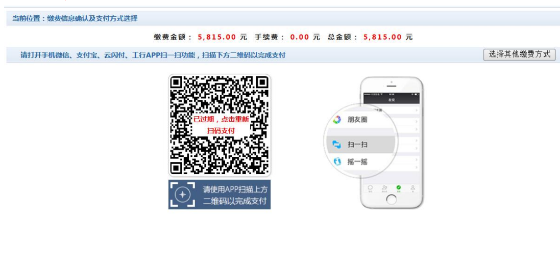
图 3.1-5 网上支付

e. 点击确定缴费后，将会弹出二维码，请使用微信、支付宝、云闪付、工商银行 APP 扫一扫进行扫码支付，如图 3.1-5 所示。 注意：请确认商户名称：山东第二医科大学