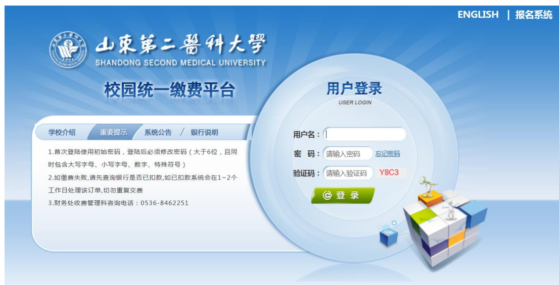
图 1-1 统一支付平台登陆界面

在浏览器地址栏输入 https://tyzfpt.sdsmu.edu.cn/xysf/ ，如图 1-1 所示。登陆之后显示个人欠费信息，如图 1-2 所示。