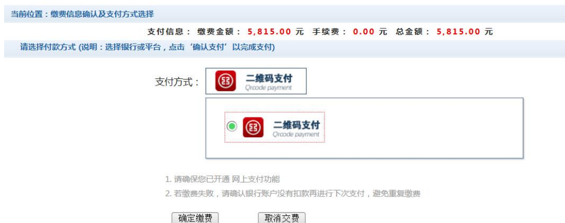
图 3.1-4 缴费方式选择

d. 缴费信息确认及缴费方式。如图 3.1-4 所示。确定支付金额无误后，选择二维码支付。